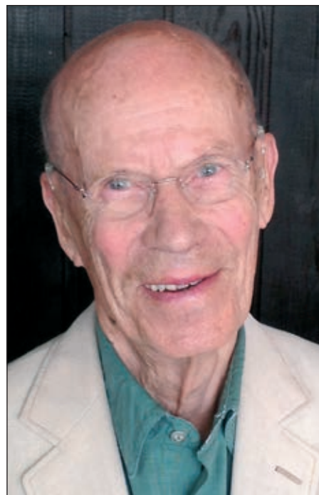
Text: Harald Sellerfors

som var med i Karl XII:s fälttåg. Pehr har under åren också sjungit i många körer. Det berättar han på sin vackra, sjungande finlandssvenska.