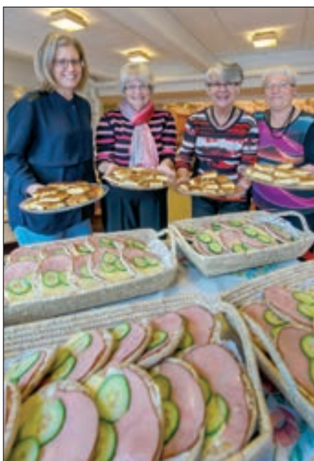
Välkomna på kyrkkaffe

Inne i kyrkan hänger en yngre man upp psalmnummer på den vita tavlan. En kvinna plockar med blommorna på altarbordet och en yngling gör en snabbtryckning med borste och skyffel. Stearinljusen i ljusbärarna har varit tända i veckan och har droppat stearin på tegelgolvet. Nya ljus måste letas upp och ställas i ordning. Lyktorna ska också tändas och ställas ut på den nysandade entrén och så kan gudstjänstbesökarna få komma. Men en kopp kaffe kanske hinns med i köket innan dörarna öppnas och alla hälsas välkomna.